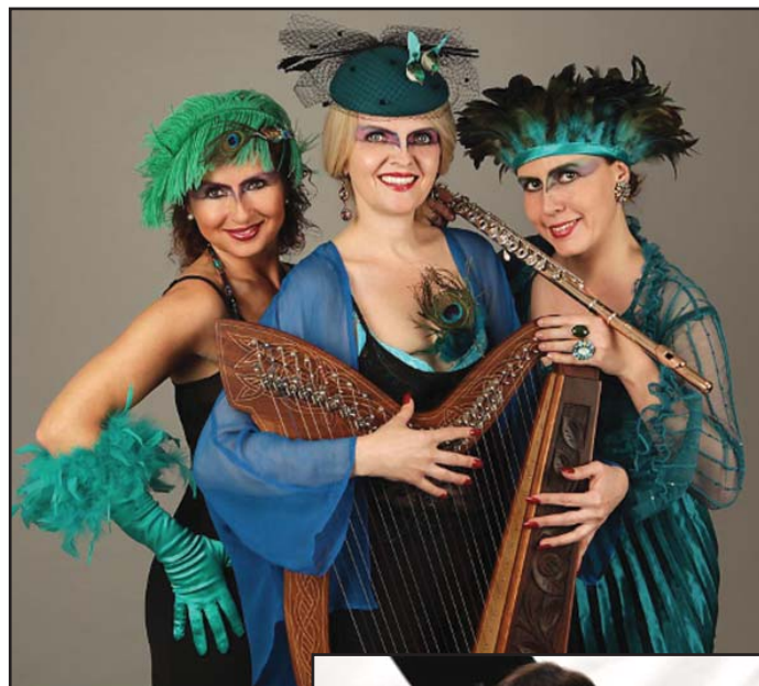
Na horním snímku soubor MUSICA DOLCE VITA

Vstupenky je možné si zakoupit v předprodeji na radnici nebo před začátkem představení v pokladně KDJS. Vstupné: 150 Kč. Délka představení cca 80 minut.