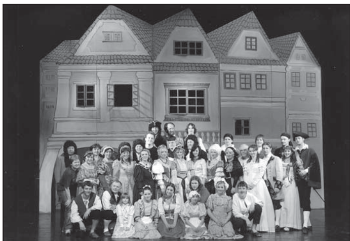
Představení Spolku divadelních ochotníků v Sedlčanech je již několik let součástí tradičního festivalu Sukovy Sedlčany. Snímek je ze hry Počestné paní pardubické (2009).