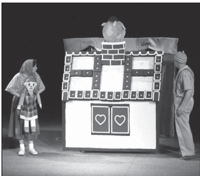
Děti z 1. stupně ZŠ a MŠ jsou zváni do KDJS na klasickou pohádku O perníkové chaloupce, kterou pro ně v úterý 27. dubna od 8.30 a 10 hodin sehraje Divadlo Duha z Polné u Jihlavy.