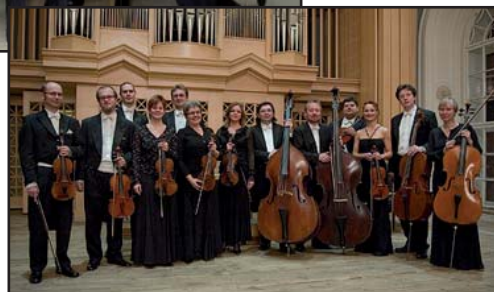
Sukův komorní orchestr

sobota 26. května v 18 hod. zámek Červený Hrádek KONCERT