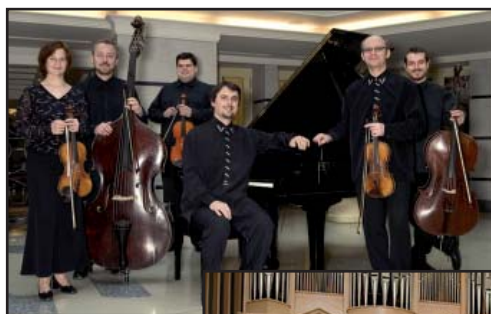
Mladota Ensemble Prague

Vstupenky je možné si zakoupit v předprodeji na radnici. Vstupné: 180 Kč. Délka pořadu je cca 100 minut + přestávka.