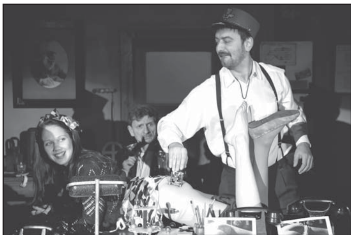
Hrabalovu novelu Ostře sledované vlaky nově nastudovalo Městské divadlo Mladá Boleslav. Diváci ji uvidí na předplatné divadla letos v říjnu.