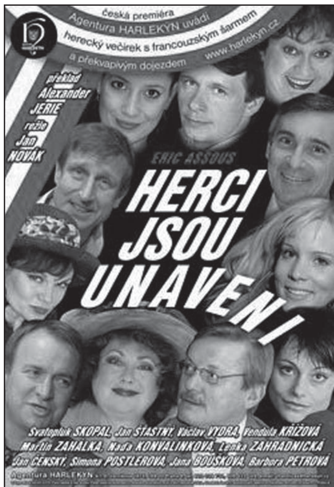
Zcela nová komedie pražské agentury Harlekyn se může pochlubit hvězdným hereckým obsazením a majitelé předplatenek na divadlo se tak mají opravdu nač těšit...