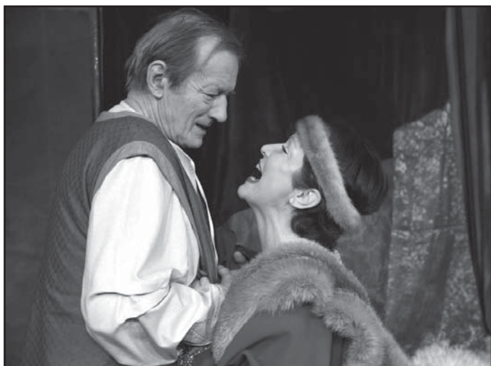
Vynikající herci Radoslav Brzobohatý a Hana Maciuchová v hlavních rolích představení Lev v zimě , které uvádíme na předplatné divadla v pondělí 11. října.