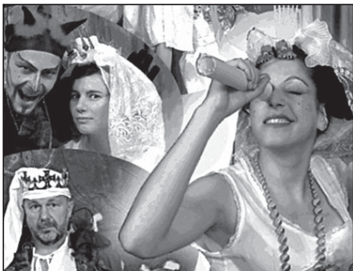
Všechny děti zveme do kulturního domu v neděli 17. října odpoledne na veselou pohádku Boženy Šimkové nazvanou Jak se krotí princezna .