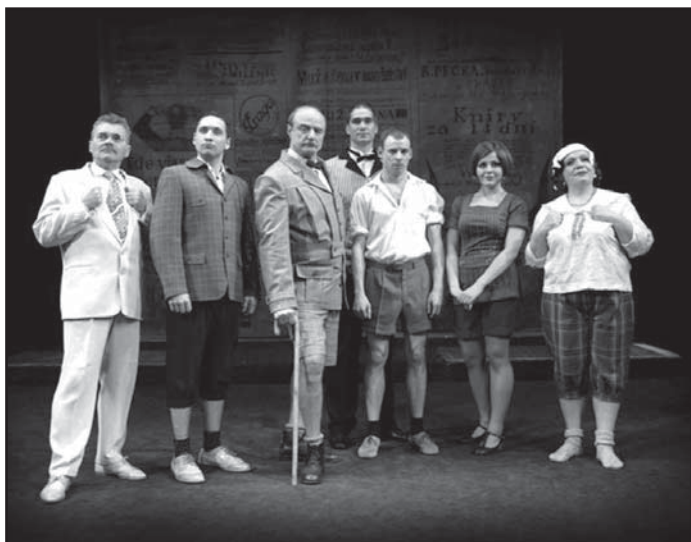
Divadlo A. Dvořáka Příbram uvede skvělou komedii Saturnin od Zdeňka Jirotky v rámci nového divadelního dárkového balíčku.