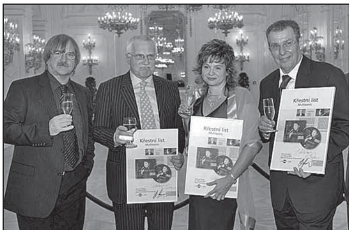
Elena Sonenshine při křtu svého CD Jazz na Pražském hradě ve společnosti prezidenta ČR Václava Klause.

Vstupenky na koncert si zajistěte co nejdříve v předprodeji.