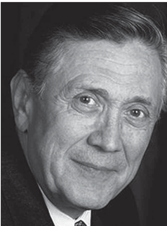
Jeden z nejlepších současných českých herců Petr Kostka bude účinkovat na předplatné poezie v pásmu nazvaném Evropský melodram.

Syn Karla Králíka je inženýr strojař a své emoce zhmotňuje do dřevěných objektů.