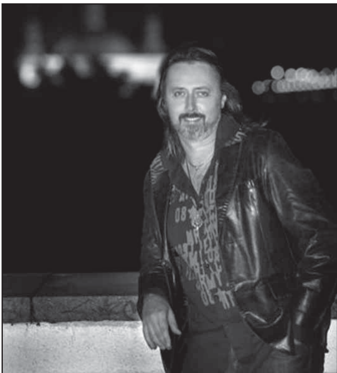
Oldřich Kříž, vynikající sólista Státní opery Praha, Národního divadla Praha a Hudebního divadla Karlín, se představí rovněž ve „Večeru světových muzikálů“.