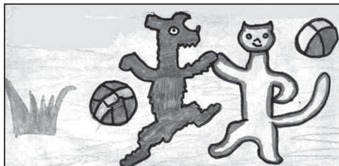
Oblíbení pejsek a kočička se v podání Hravého divadla Brno představí dětskému publiku ve čtvrtek 23. září.